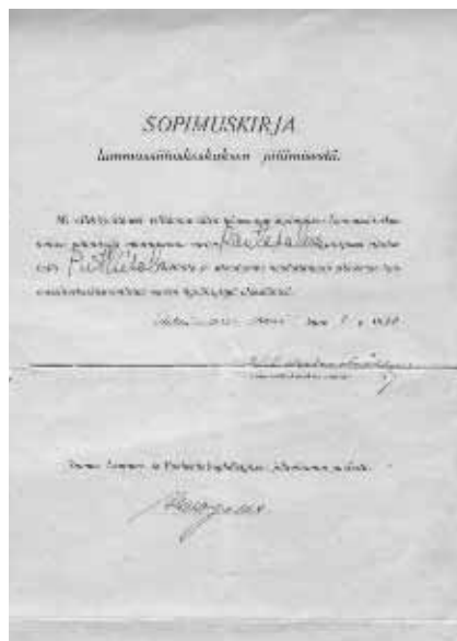
Sopimus lammassiitoskeskuksen pitämisestä vuodelta 1930. Tällä sopimuskirjalla Putkisaloon kartano sitoutui jalostamaan tilallaan suomenlammasta

Vuonna 1918, eli virallisen rodun syntymisen aikaan, Suomessa oli vielä olemassa vanha kulttuuriraja idän ja lännen välillä ja siihen pohjautuva jako läntiseen ja itäiseen lammastyyppiin. Pohjanmaalla ja Satakunnassa lampaat olivat pieniä, 20–25-kiloisia, kun taas Itä-Suomessa lampaat olivat hieman kookkaampia, 40–60-kiloisia, ja nopeakasvuisempia. Olisi ollut täysin mahdollista tehdä molemmille oma kantakirjansa ja kirjata eri tyyppien edustajat omiksi alueelliseksi muunnoksiksi, kuten suomenkarkajalla, josta päätettiin tehdä kolme alueellista variaatiota. Yhdistys kuitenkin valitsi tulevaisuudeksi suomenlampaaksi vain toisen version, sillä maatiaislampaalle asetettiin tietyt tyyppivaatimukset koskien villan laatua ja määrää, teuraspainoa ja sikiävyyttä (sarvelisuus ja väri eivät olleet alussa määrääviä tekijöitä) ja itäsuomalainen versio paremmin vastasi näitä tavoitteita. Sillä oli tyydyttävä koko, hyvä kasvukyky, erinomainen sikiävyys ja laadun ja määrän suhteen tyydyttävä villa. Näitä lampaita levitettiin sitten maan etelä- ja länsiosiin.