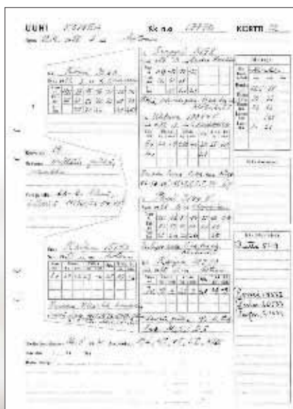
Suomenlammassuuhin Komean uuhikortti Putkisaloon kartanosta Rantasalmelta.