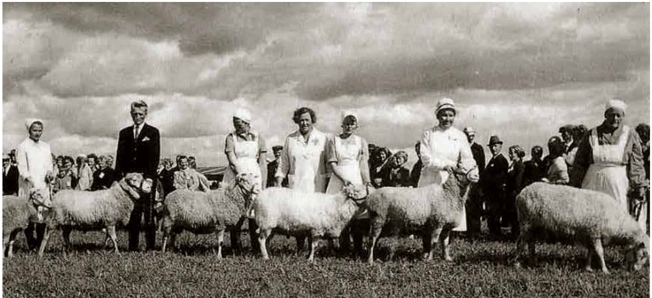
Kansikuva teoksesta 80 vuotta järjestettyä lampaanjalostusta.

Suomen Lammasyhdistyksen juhluvuoden kunniaksi julkaistun artikkelisarjan ”Suomalainen lammas” neljäs osa tuo lukijoiden ulottuville viimeiset 150 vuotta suomalaisen lampaan lähihistoriaa. Tähän mahtuvat niin maatalouden murros ja teollistumisen aiheuttamat yhteiskunnalliset muutokset, kuin maan itsenäistyminen ja EU-aikaan siirtyminenkin. Lampaanhoidosta tulee lammastaloutta ja ala pääsee osaksi sekavaa maatalouspolitiikkaa. Aikahaarukkaan mahtuvat myös sataa vuottaan juhliva Suomen Lammasyhdistys ja satavuotias suomenlammas.